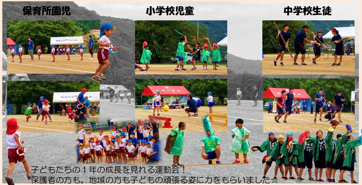
子どもたちの1年の成長を見れる運動会！ 保護者の方も、地域の方も子どもの頑張る姿に力をもらいました☆