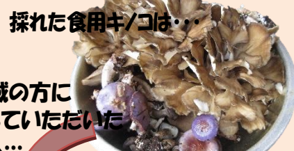
採れた食用キノコは…