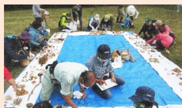
森林インストラクターの方によって仕分けられるきのこたち…