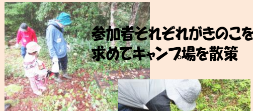
参加者それぞれがきのこを求めてキャンプ場を散策

今年も開催しました！♠裏匹見峡でのきのこ狩り♠ 例年多くの方にご参加いただいている大人気イベントですが、今年も35名の方にご参加いただきました。裏匹見峡できのこを求めて散策、専門家によるきのこの仕分け、採ったきのこでキノコ汁を堪能し、きのこ尽くしの体験となりました♡