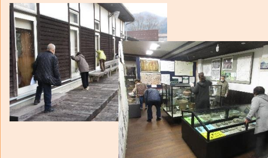
みなさん、ありがとうございました♡

寿会の皆さんによる館内の清掃作業が行われました。施設が大きく普段なかなか手入れの行き届かない公民館ですが（…ただただ私からずな…だけ？）、皆さんのおかげで今年もピカピカ！！きれいな公民館で年を越せることをありがとうございます(◡>◡<)。💖