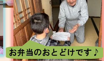
お弁当のおとどけです！