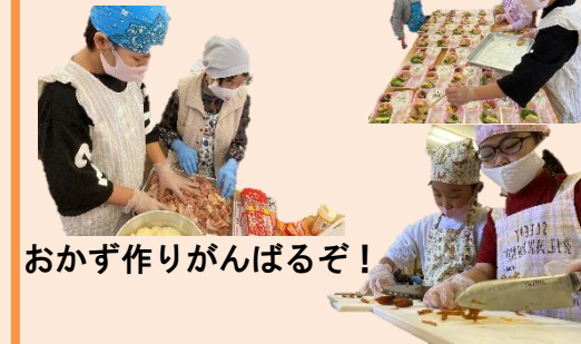
おかず作りがんばるぞ！

振替休業日で学校がお休みだった小学生、お弁当作りに挑戦しました！作ったお弁当は、地域の方と食べたり、自宅までお届けに行きました♪一緒にお弁当を食べた後は…文化財課の方による日本遺産についてのお話を聞きました。