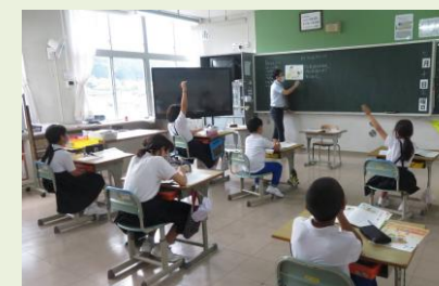
小学校2学級の授業の様子

翌11日(土)は匹見中学校で、午前中の弁論大会を見学しました。全校生徒や保護者の皆さんが見守る中、生徒がそれぞれ日頃の生活の中で感じている自分の思いや考えを素直に堂々と発表していました。