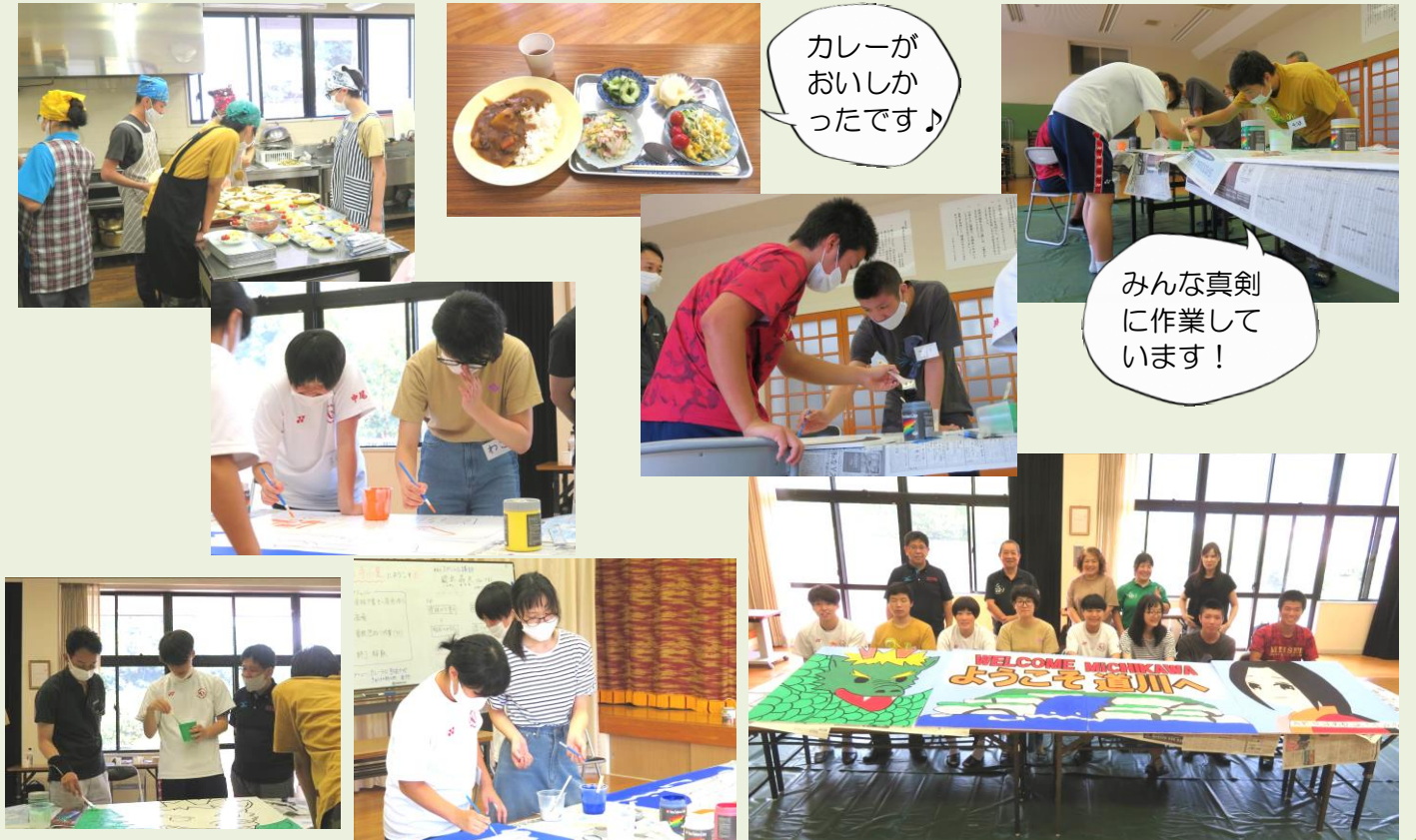
カレーがおいしかったです！

10月8日午後1時30分から、出合いの里の前で受け渡し式をして看板を設置する予定です。お楽しみに！（ご都合のつく方はぜひいらしてください！）