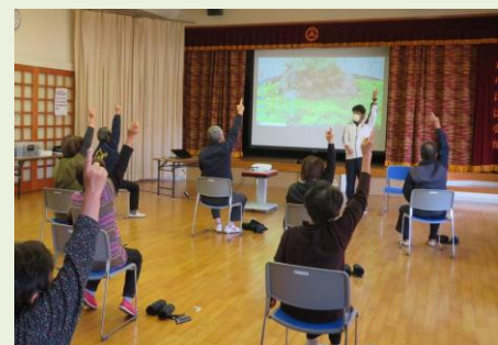
日高指導員によるストレッチ体操