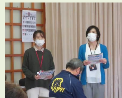
匹見包括支援センターの職員のお二人