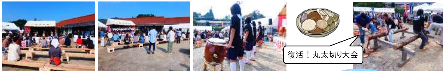
復活！丸太切り大会

その他にも、「丸太切り大会」の何年かぶりの復活、バザーやフリーマーケット、喫茶店などの多彩な出店もありました。