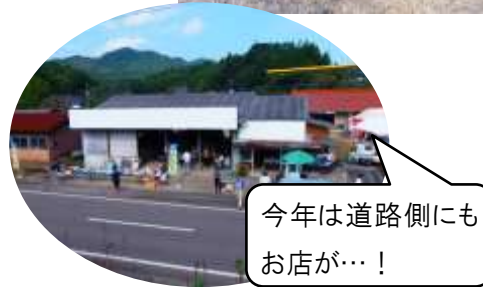
今年は道路側にもお店が…!

11月1日(土)～3日(月)文化の日「二条公民館文化祭」が開催されました。3日間で約270名の方に来館頂き、作品を見て頂きました。